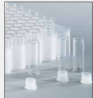
98723-02 Viales con tapas

Puede optar por viales de vidrio borosilicato tipo I transparentes en tres tamaños, o viales de polipropileno (PP) de 700 µl de volumen limitado.