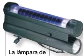
La lámpara de luz ultravioleta 97602-30 tiene una linterna.