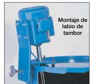
Montaje de labio de tambor