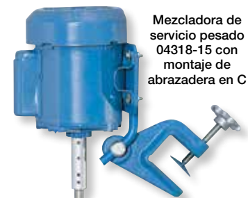
Mezcladora de servicio pesado 04318-15 con montaje de abrazadera en C

YV-50509-10 Impulsor fijo de repuesto , 4" diám. x 5/8" diám. interior (102 mm diám. x 16 mm diám. interior)