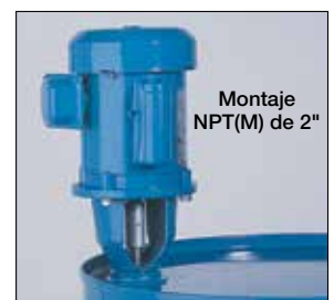
Montaje NPT(M) de 2"