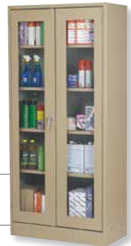
Gabinete de piso 47546-62