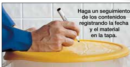
Haga un seguimiento de los contenidos registrando la fecha y el material en la tapa.