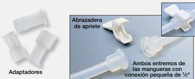
Abrazadera de apriete