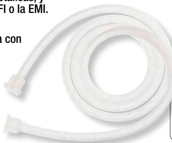
Mangueras de silicona curada con platino con conexiones pequeñas de 1/2"