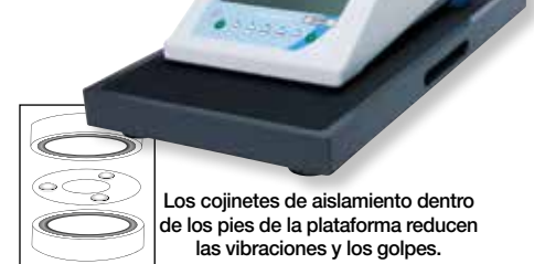
Los cojinetes de aislamiento dentro de los pies de la plataforma reducen las vibraciones y los golpes.