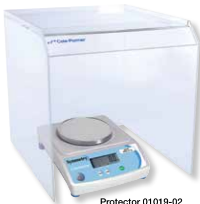
Protector 01019-02 (no se incluye la balanza)